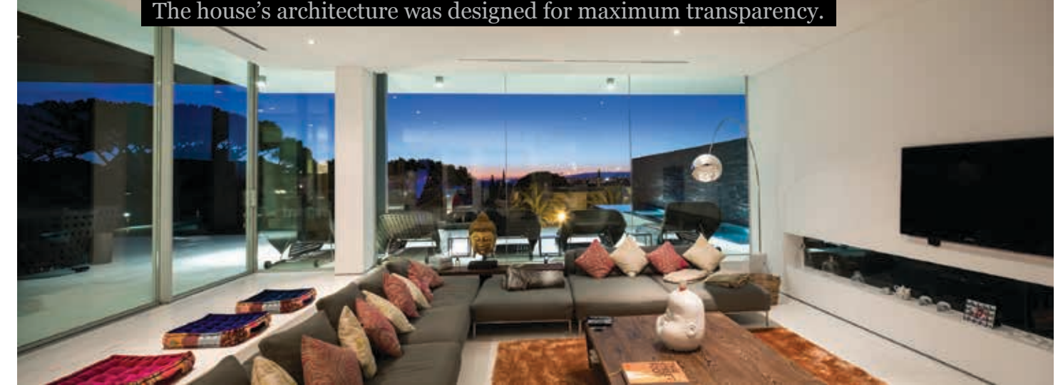
LA MAISON A ÉTÉ CONÇUE POUR UN MAXIMUM DE TRANSPARENCE. The house's architecture was designed for maximum transparency.